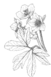
クリスマスローズ